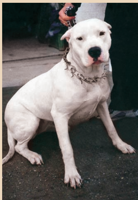
9-mesačná sučka s výborným tmavým okom – Athina Zu-Ju.