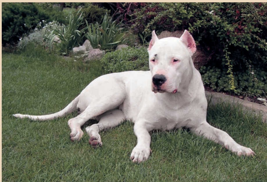
Prisca del Tolkeyen