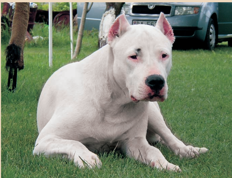
Jeden fľak tmavej farby na hlave je povolený.