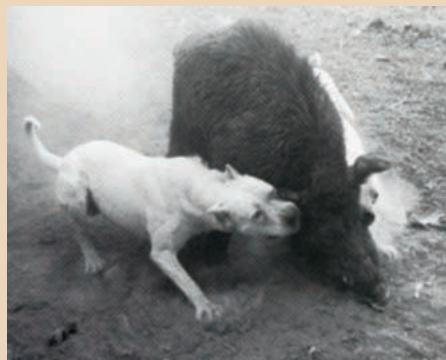
Lov na diviaka.

Prvé psy do tejto oblasti doviezli španielski a portugalskí kolonizátori na začiatku 16. storočia. Psy conquistadorov pochádzali z Pyrenejského polostrova, odkiaľ sa vlastne organizovali všetky výpravy do Nového sveta. Boli to vlastne mohutné dogo-