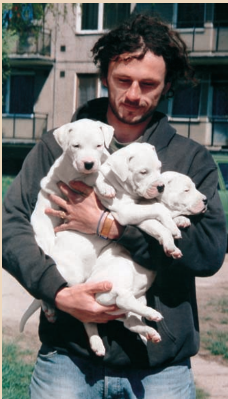
7-týždňové šteniatka argentínskej dogy.

nými psami, ktorú bolo potrebné do istej miery potlačiť, aby sa na poľovačkách mohla používať celá svorka. Tieto skupinové lovy sa skladajú zo štvania, ulovenia a zadržania, usmrtenia diviny. Nazývajú sa monteria a pozostávajú zo 4 až 5 psov.