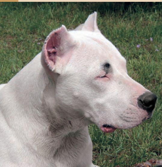
Príklad hlavy s minimálnym stopom – Prisca del Tolkeyen.